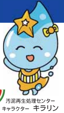
汚泥再生処理センター キャラクター キラリン