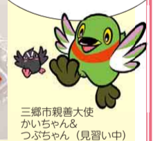
三郷市親善大使かいちゃん&つぶちゃん(見習い中)

今回は三郷市とコラボ! 三郷市PRキャラクターかいちゃん&つぶちゃんグッズを特別にいただきました。