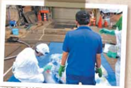
「搬入事業者とごみ袋の中を確認」