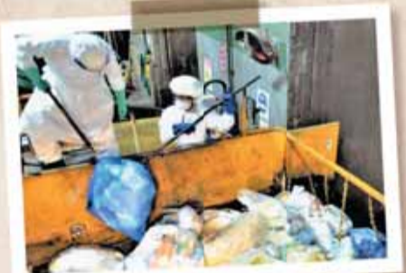
「収集車が搬入したごみを検査している様子」