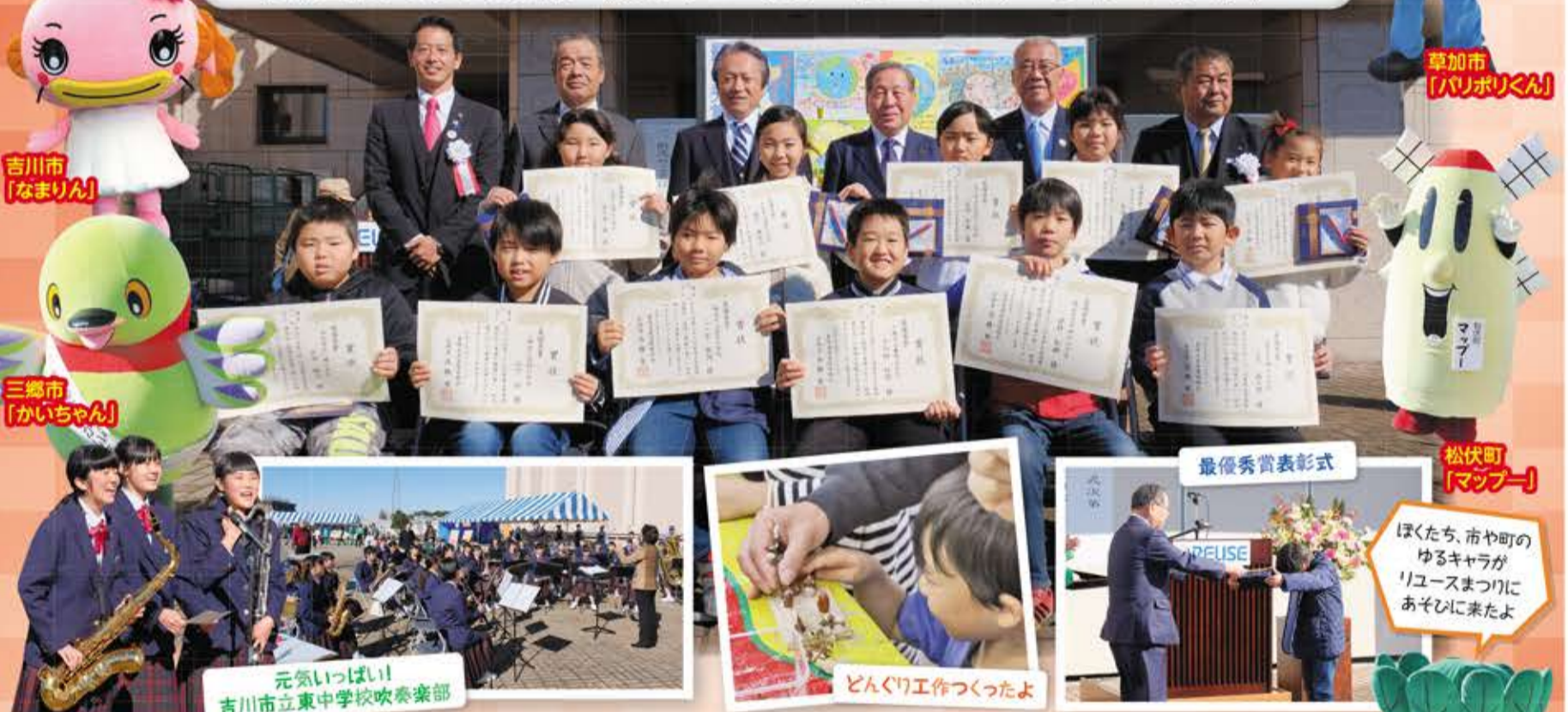
元気いっぱい 吉川市立東中学校吹奏楽部