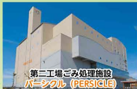
第二工場ごみ処理施設 パーシクル (PERSICLE)