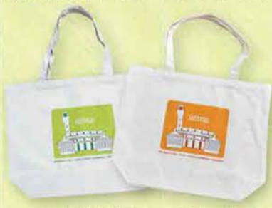
オリジナルエコバッグ

各市町のイベントにお越しの際は、ぜひ「東埼玉資源環境組合」の看板を目印にお立ち寄りください。 エコバッグ の販売も行っております!