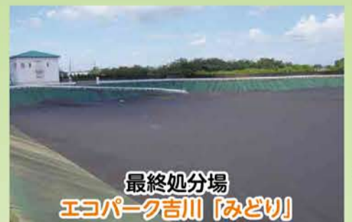
最終処分場 エコパーク吉川 [みどり]