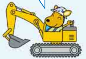
第一工場キャラクター かんちゃん

(※)準備書とは、事業の実施が、環境に及ぼす影響について、住民や知事の意見、現地調査結果等を踏まえて、まとめたものだよ