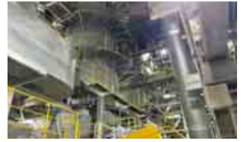
第一工場ごみ処理施設内