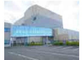
第二工場ごみ処理施設