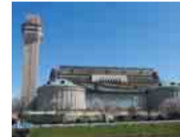
第一工場ごみ処理施設