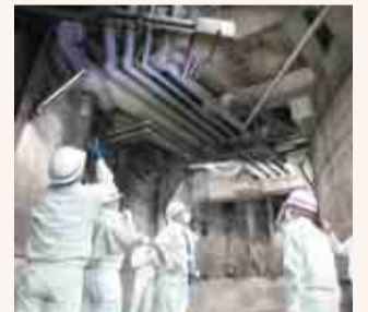
現場確認による工事内容の検討

また、埼玉県環境影響評価条例に基づく環境影響評価の手続きでは、騒音や臭気、水質などの現地調査を継続するとともに、環境影響評価準備書の策定を進めていきます。