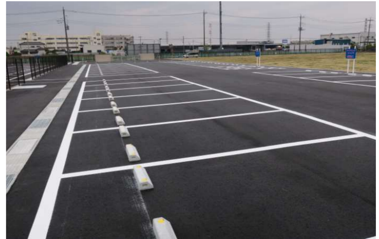
② 完了（敷地内駐車場より）