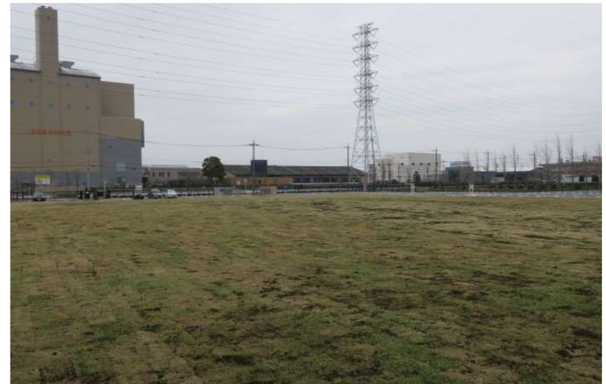
③ 完了（多目的広場南西より）