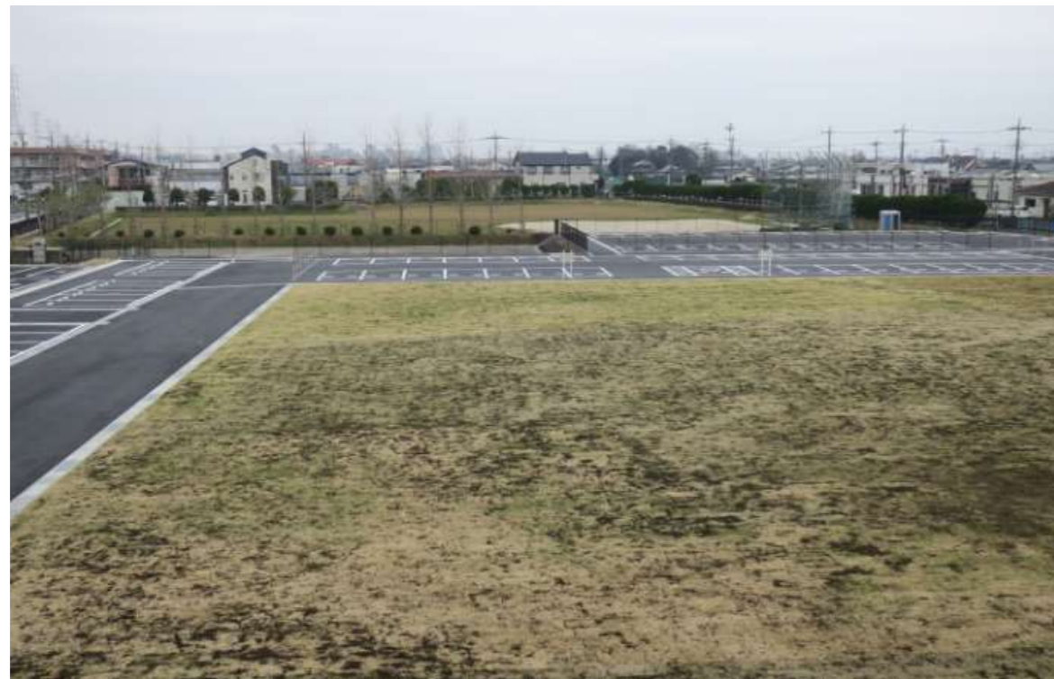
① 完了（汚泥再生処理センター2階より）