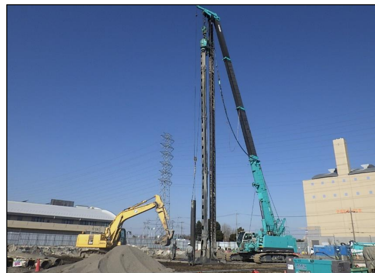
杭抜き状況（取水調整槽）