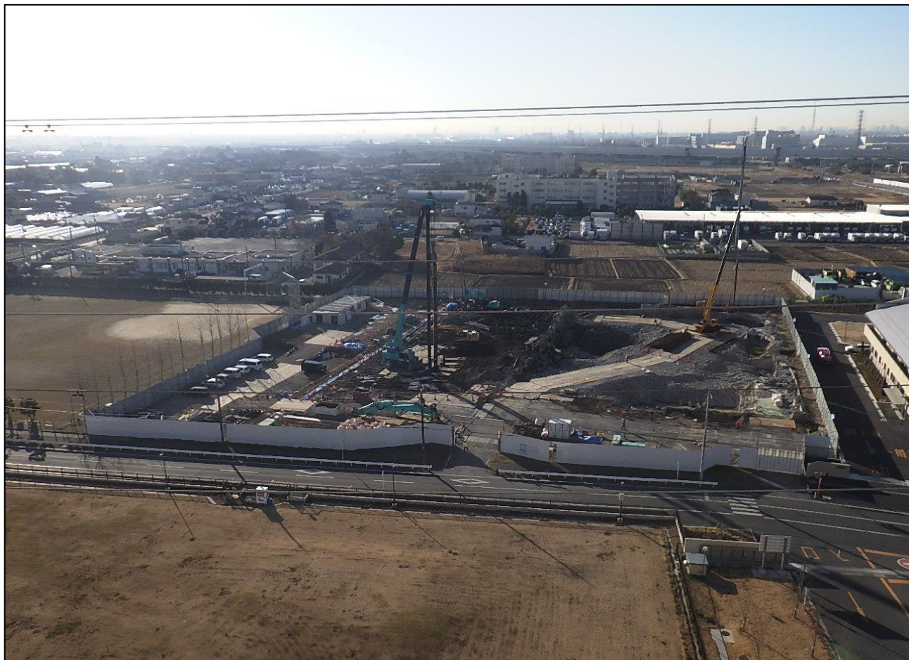
全景写真（ごみ処理施設工場棟より）